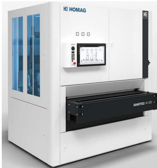
Abbildung 2

Schleifbreite: 1350mm Schleifdicke: 5-160mm Anwendung: Furnierschliff, Feinschliff Holz und Holzwerkstoffe, Lack und Füllerschliff; Hochglanzschliff bis Körnung P2500 möglich