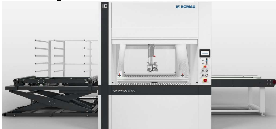
Abbildung 3

maximale Plattenabmessung: 4000 x 1350 mm maximale Dicke: 240mm